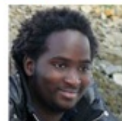
1 - Qui c'est ?...