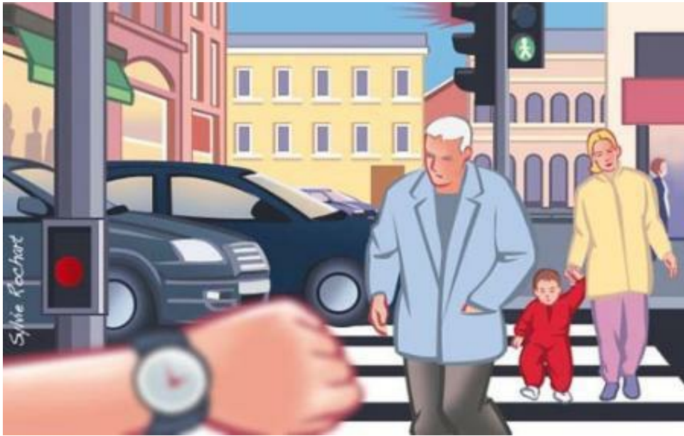
Presbyte : vous voyez difficilement de près