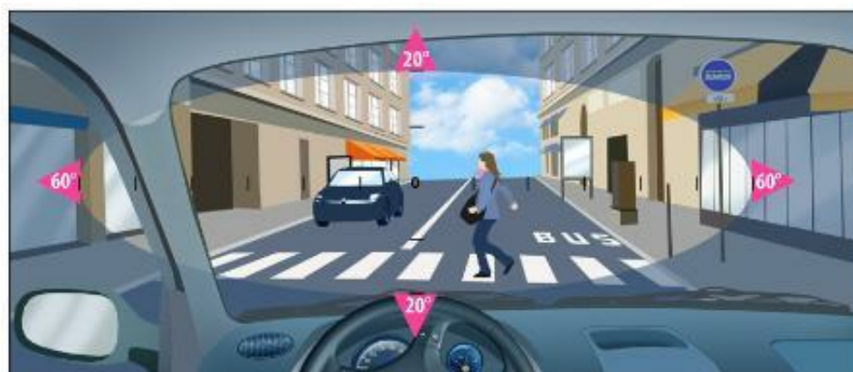
Schéma 5 : Vue antéro-postérieure de l'œil avec glande lacrymale et septum

Si l'un des deux yeux a moins de 1/10 l'autre œil doit avoir 5/10 et un champ visuel binoculaire horizontal d'au moins 120°, ce champ visuel doit s'étendre d'au moins 50° vers la gauche et la droite et de 20° vers le haut et le bas.