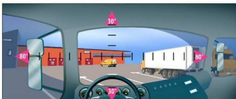
Schéma 5 : Vue antéro-postérieure de l'œil avec glande lacrymale et septum

Dans les 60° centraux, il ne doit y avoir absolument aucune anomalie du champ visuel des 2 yeux.