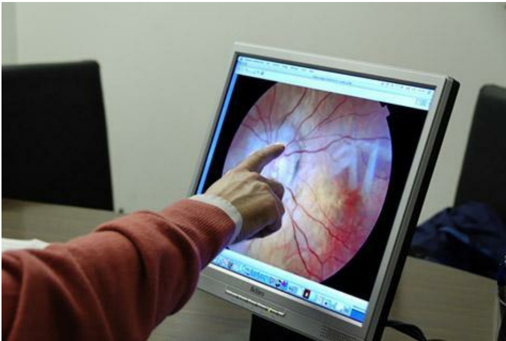
'oeil visualise la rétine, les vaisseaux et le nerf optique