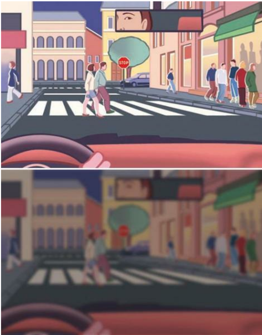
La cataracte se traduit surtout par une vision floue avec des couleurs et des contrastes atténués.

En général, la cataracte s'accompagne d'une baisse de l'acuité visuelle, c'est-à-dire de la précision de la vue, malgré des changements de lunettes. Elle peut ainsi avoir des conséquences directes sur les activités de la vie quotidienne. Lorsque la cataracte est très évoluée, la pupille devient grisâtre ou blanchâtre.