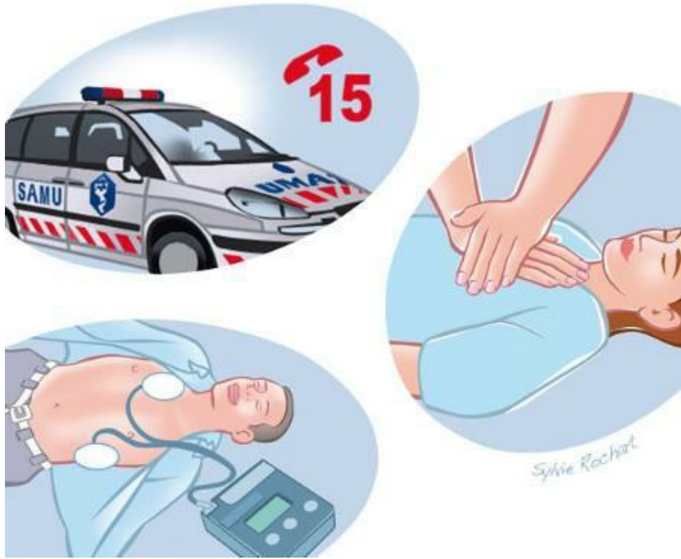
Les 3 gestes qui sauvent