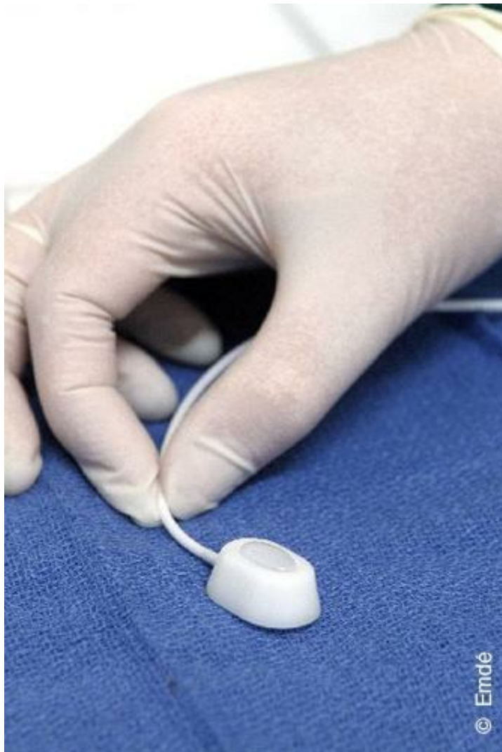
Éléments constituant vos yeux