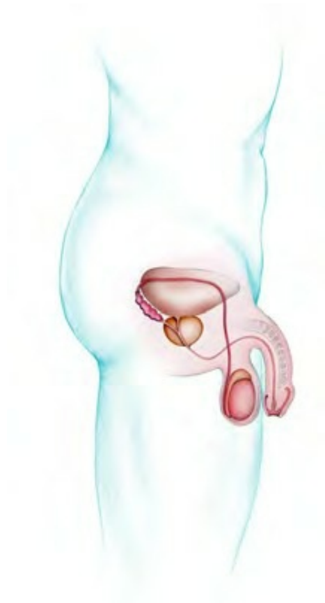
Illustration schématique de l'appareil génital de l'homme 1