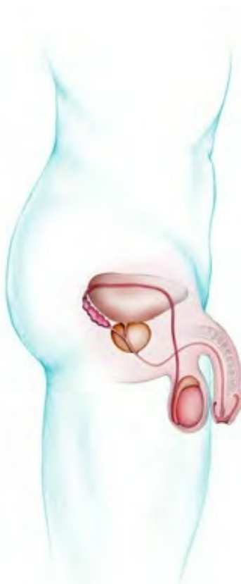
Illustration schématique de l'appareil génital de l'homme 1

Ces schémas permettent de visualiser l'anatomie de l'appareil génital de l'homme. Votre médecin pourra les commenter avec vous. Ils vous permettront de mieux comprendre les explications et recommandations qui vous seront apportées dans votre parcours.